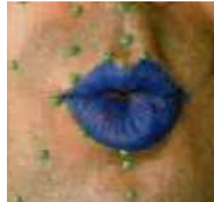
Exemples de positionnements des articulateurs orofaciaux lors de la production de la parole (à gauche vue radiographique du conduit ; à droite vue de face des lèvres)

Dans ce contexte, la notion de "modèle interne", c'est-à-dire de modèle du système moteur permettant de simuler le système moteur « dans son cerveau » et d'inférer les commandes motrices appropriées à l'exécution de la tâche, est un cadre théorique largement discuté depuis la fin des années 1980. Mais la plausibilité biologique d'un tel modèle est encore débattue aujourd'hui. En effet, la nature déterministe des modèles classiquement proposés dans la littérature ne permet pas de bien comprendre la variabilité des gestes observés lorsqu'un sujet produit une même séquence de phonèmes à des instants différents. L'exploitation de tels modèles passe par un calcul explicite d'erreur entre sortie désirée et sortie effectivement produite, dont on ne connaît pas les corrélats neurophysiologiques potentiels... Dans ce contexte une description probabiliste de ces « modèles internes » suscite aujourd'hui un fort intérêt.