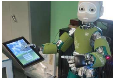
Figure 2 : exemple de deixis brachio-manuelle.